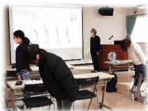
実践の様子（お辞儀）

他者に分かりやすく自分の考えを伝えること、そして、人と人とが繋がろうとすることは、社会人として生きていくために、また日常生活を営む上でも非常に大切なことと考えます。今回の学習を通して参加者がそのことを改めて感じ、実践へ結びつけていくことを願います。皆で楽しくゲームをするなど心温まる時間を過ごすことができました。