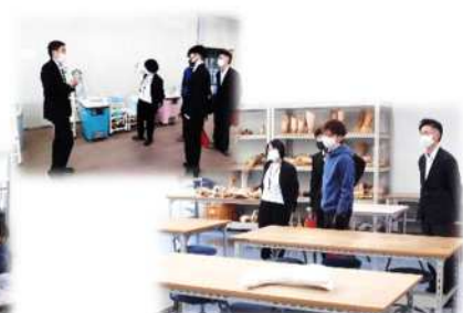
リハビリテーションカレッジ島根