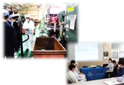
ケーピー株式会社