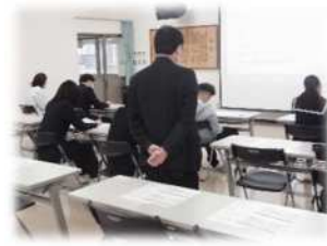
ワークシートに取り組む様子