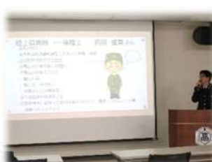
講演の様子（西田さん）