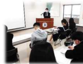
ワークシートに取り組む様子