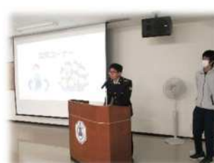
生徒質問への回答の様子