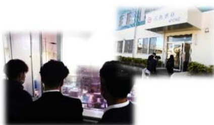
石見食品株式会社

自分の将来を考える良いきっかけとなり、有意義なものとなりました。見学先の各社、各校もお忙しい中での本校の訪問でしたが、熱心、丁寧に受け入れていただきありがとうございました。