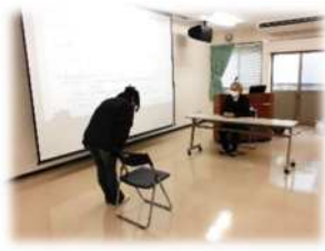
実践の様子（個別面接）