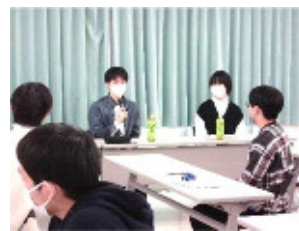
生徒質問への回答の様子