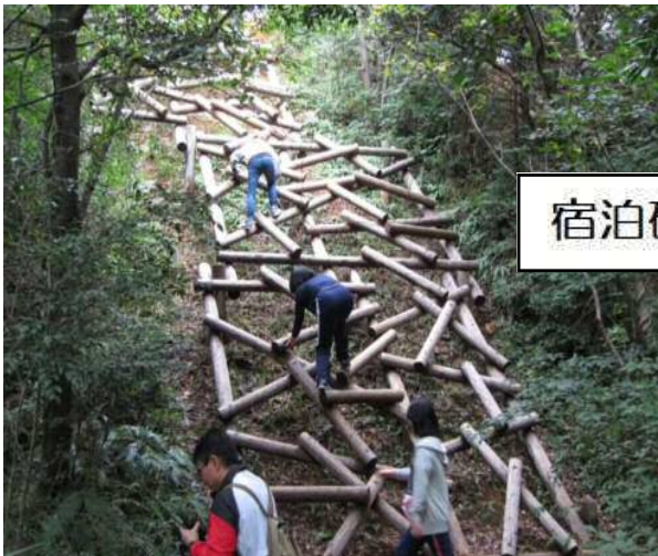
宿泊研修 in 少年自然の家