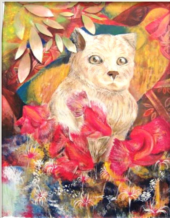
タイトル 「綾錦」 1 A 松下由香 作

今年も残りわずかとなりました。レポートも全て終わり、クリスマス、お正月と楽しいことばかりですね。ちょっと時間に余裕があるときに今年を振り返ってみてください。